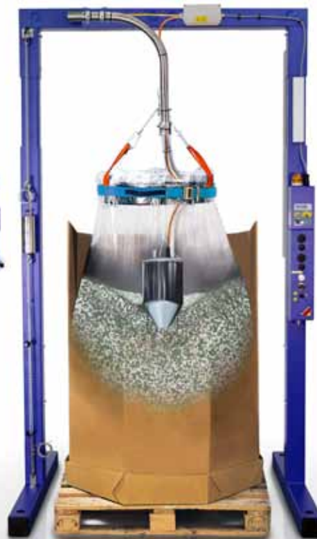
CLASSIC PLUS med option 1

Ubemandet komplet tømning uden løft, vipning eller omrøring af den fyldte beholder og de dermed forbundne problemer.