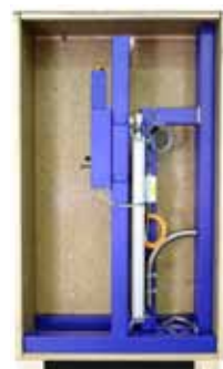
formonteret i transportkasse