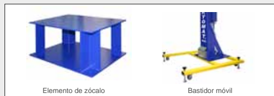
Elemento de zócalo