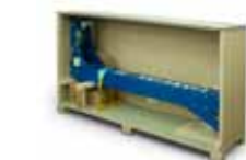
Completamente premontada en caja de transporte