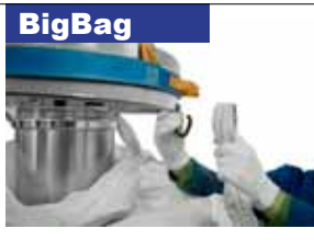
Obesiti zanko za BigBag