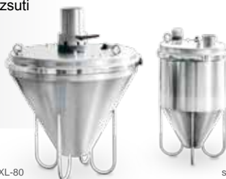
sesalna glava XL-80

Sesalna glava plava in vibrira v materialu, tako da kepe materiala razpadajo.